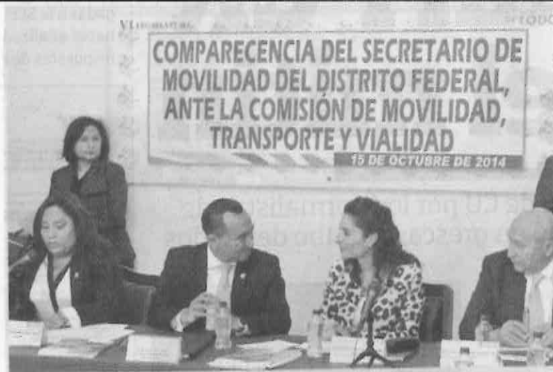
QUESTIONADO. El titular de Semovi acudió ayer a la Asamblea capitalina.

Por su parte, la bancada de Movimiento Ciudadano le pidió más involucramiento en el tema de Línea 12, pues la Semovi parece desaparecida del asunto; diputados de esta fracción mencionaron que la nueva y flamante secretaria ha lucido sólo como expendedora de engomados y placas.