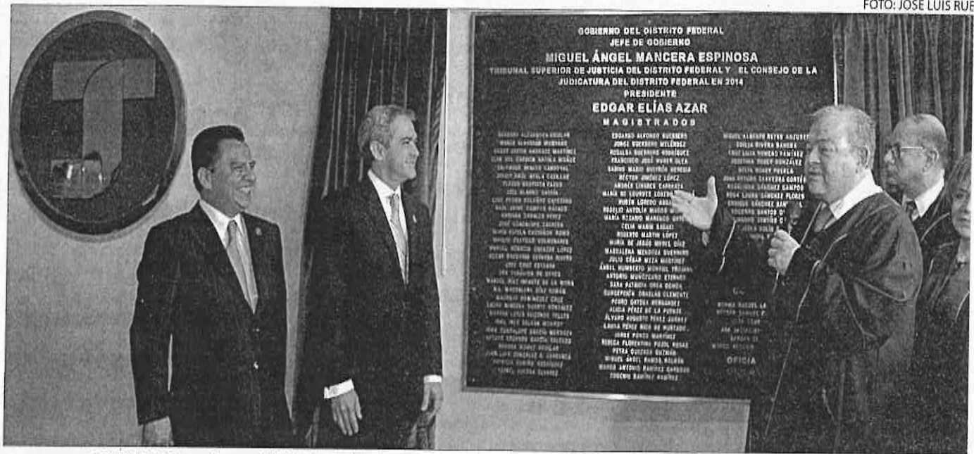
» EL EDIFICIO Juan Álvarez del TSJDF cumplió 50 años y a la celebración acudió el jefe de Gobierno capitalino, Miguel Ángel Mancera.