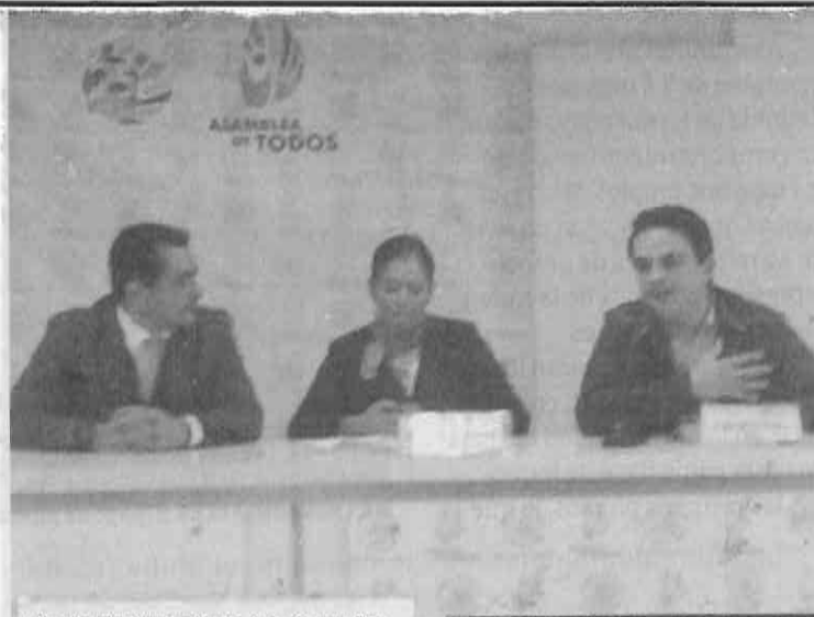
PIDEN SEGUIMIENTO. Los diputados exhortaron a crear una comisión que siga el caso del supuesto fraude.