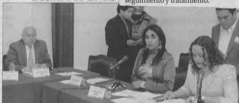
» LA COMISIÓN de Educación de la ALDF sacó adelante varios dictámenes sobre el caso del bullying.

Finalmente, con dichas modificaciones se busca atender la identificación del trastorno por déficit de atención e hiperactividad, para su seguimiento y tratamiento.