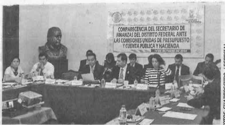
CITADO. Ante asambleístas, el funcionario detalló los costos de rehabilitar la L12.

se gastaron en el diagnóstico de las fallas.