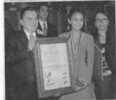
Paola Espinosa, un orgullo para México.