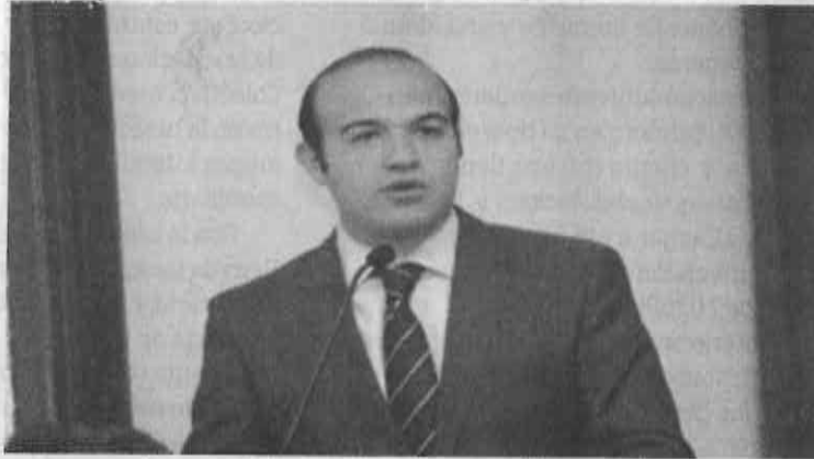
PREOCUPACIÓN. Vecinos reportan que seguridad se ha deteriorado.

Desde hace varios meses, los vecinos le reportaron la falta de seguridad al diputado. ■