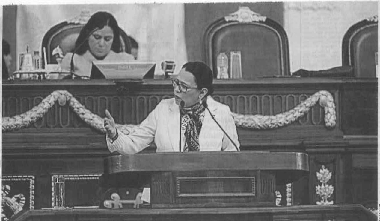
RESULTADOS. La titular de la Secretaría de Desarrollo Social capitalina, Rosa Icela Rodríguez, asistió a la Asamblea Legislativa como parte de la Glosa por el segundo Informe de Gobierno de Miguel Ángel Mancera

De la misma manera, la titular de la Secretaría de Desarrollo Social capitalina dijo que seguirá luchando para que las mujeres gocen de una vida libre de violencia y cuenten con las mismas oportunidades en escuela y trabajo, y para los adultos mayores, seguir pugnando porque vivan su vejez con dignidad.