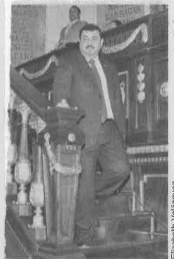
■ El Contralor Hiram Almeida compareció ayer en la ALDF.

Cuestionado sobre las responsabilidades del Consorcio Alstom-ICA-Carso señaló —sin detallar— que podría ser inhabilitado si no paga la penalización de 2 mil 500 millones de pesos por incumplir contrato.