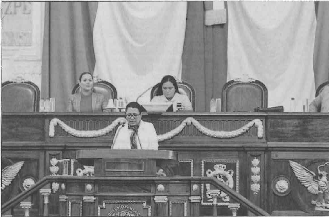
COMPROMISO. La secretaria de Desarrollo Social considera que es necesario continuar con la aplicación de políticas sociales.