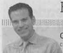
CARLOS LORET DE MOLA carlosloret@yahoo.com.mx