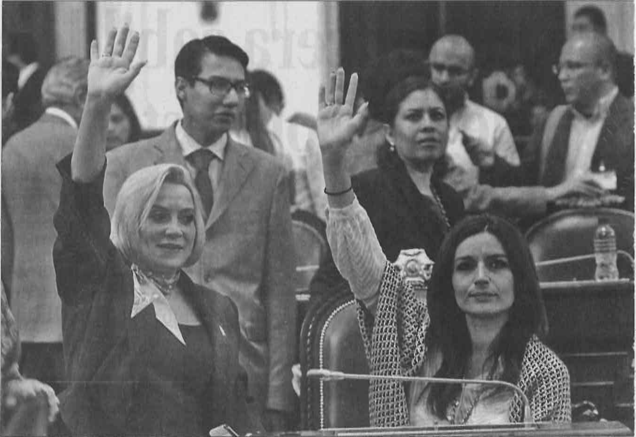
>> EL GRUPO parlamentario panista urgió a la SSPDF que dé a conocer estadísticas de personal evaluado.