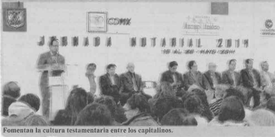
Fomentan la cultura testamentaria entre los capitalinos.

Comentó que las Jornadas Notariales seguirán su marcha y que nadie por muy pobre que sea quedara fuera de cualquier programa social realizado por el gobierno capitalino que su principal preocupación es el beneficio de todos los capitalinos.