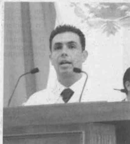
Sesma aseguró que este tema no está cerrado.

ta iniciativa se dicte en el próximo periodo ordinario de sesiones.