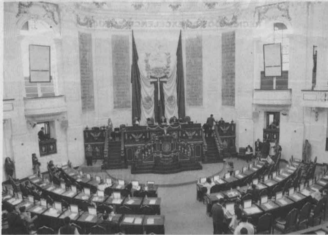
Asambleístas elaborarán una política pública clara en beneficio de la ciudad y del desarrollo de vivienda social