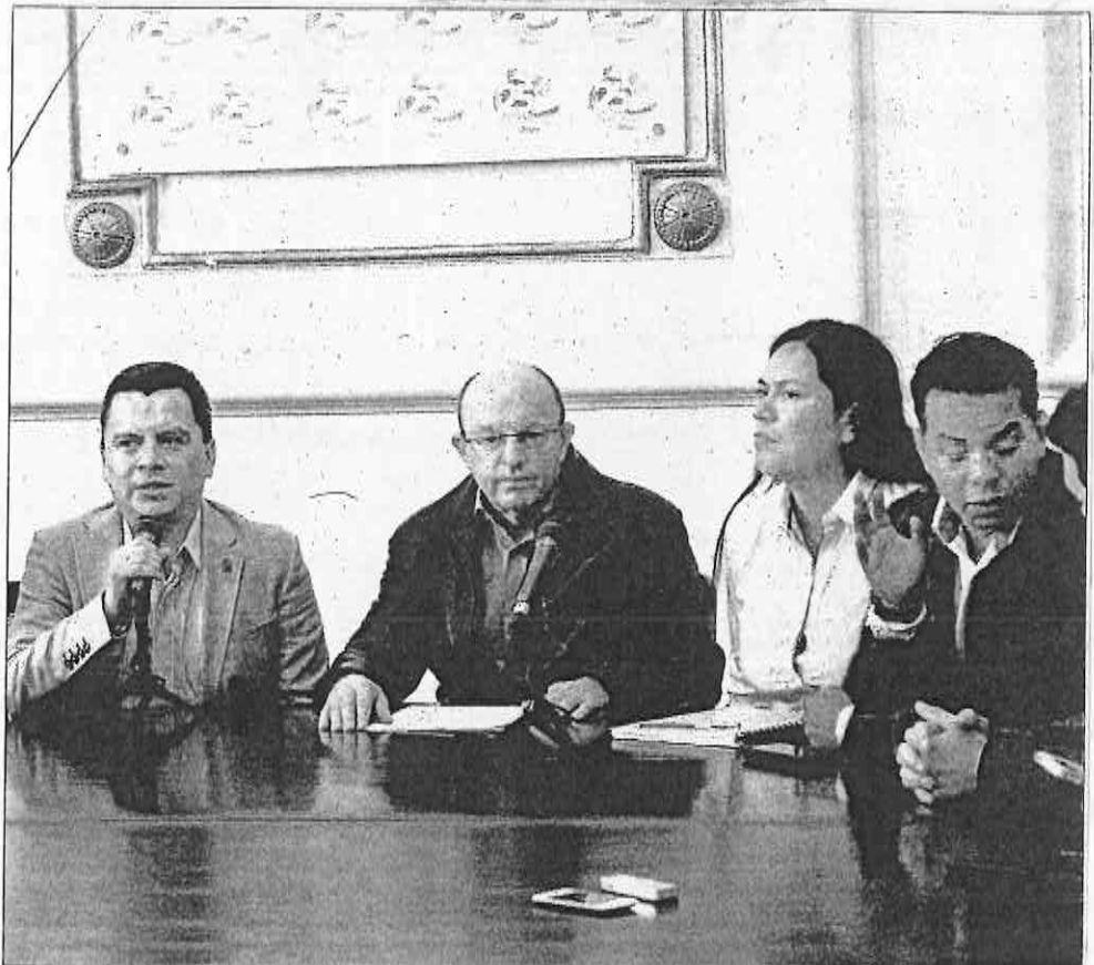
NEGOCIACIÓN. Diputados y el titular de la Seduvi acordaron abrir el debate con los actores involucrados.

Dijo que la Secretaría de Desarrollo Urbano en conjunto con la Procuraduría Ambiental y del Ordenamiento Territorial, se encargarán de dar seguimiento a las aportaciones técnicas e integra-