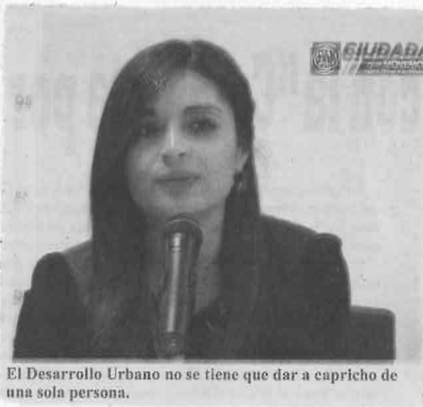
El Desarrollo Urbano no se tiene que dar a capricho de una sola persona.

Refirió "Acción Nacional lo dice públicamente, seguiremos impulsando un esquema en el que se encuentren incluidas todas las voces de cada uno de los ciudadanos, pero también de los factores que tengan que ver en la planeación de la ciudad. No solamente podemos circunscribir las necesidades en temas como movilidad o usos de suelo mixto, también tenemos que considerar otros factores, como lo mencionaba antes y estaremos muy al pendiente de que así sea".