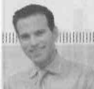
CARLOS LORET DE MOLA carlosloret@yahoo.com.mx