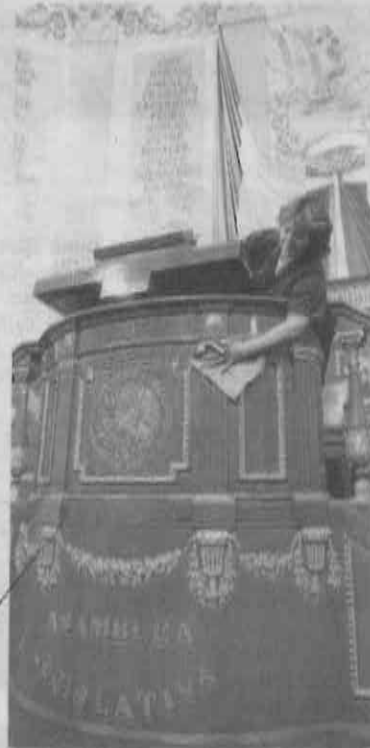
Critican a la administración local por el bajo salario del personal de limpieza

La Oficialía Mayor contabiliza cuántas empresas de limpieza trabajan para el GDF y qué condiciones brindan a sus empleados, para regularizarlas.