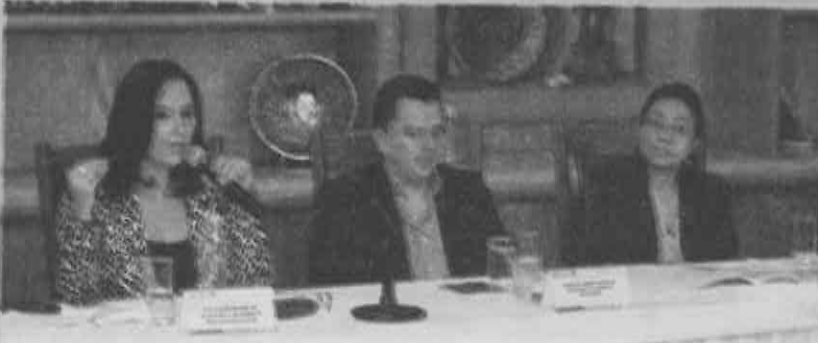
Normas Generales de Ordenación 30 y 31 no pasarán.

Puntualizó "las principales demandas de los afectados es que se desechen las disposiciones, por no ser ni de interés social ni basarse en ninguna categoría de planeación urbana, solicitaran un listado a Seduvi de lo que se consiguió por Norma 26, que contenga las constructoras que realizaron obras, funcionarios que dieron permisos y el procedimiento que se le ha dado".