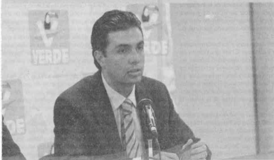
Las delegaciones obligadas a mantener actualizado su padrón de negocios en sus territorios.

Recalcó que la Ley de Establecimientos Mercantiles del Distrito Federal indica que las delegaciones políticas están obligadas a mantener actualizado el padrón de los establecimientos mercantiles que operen en sus demarcaciones y publicarlo en su portal oficial de Internet, pero la información que ahí se ofrece resulta incompleta.