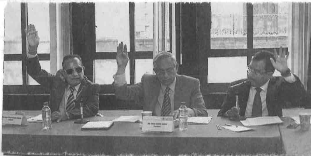
» LA COMISIÓN de Asuntos Laborales y Previsión Social en la ALDF aprobó el dictamen de reformas de la Ley de Protección y Fomento al Empleo para el Distrito Federal.

En otro punto, la comisión exhortó a los titulares de la Oficialía Mayor y de la Secretaría de Obras y Servicios del Distrito Federal, a que implementen un programa para la contratación de tipo extraordinario de los trabajadores voluntarios no asalariados de limpieza del Distrito Federal.