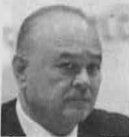
Ernesto Ruffo Appel Senador del PAN

Legisladores locales y federales de diversos partidos rechazaron el pago, con cargo al erario, del seguro para assembleístas.