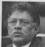
Miguel Alonso Raya Diputado federal del PRD

"Nada justifica que se cubra este tipo de gasto. No hay nada que justifique que le paguen a uno por estar en estado de ebriedad"