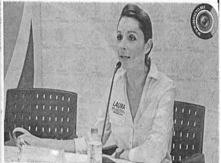
La legisladora panista urge dar un seguimiento al proyecto en aras de la transparencia

Federal, del Estado de México e Hidalgo, así como de sus congresos locales, debido a que de los 30 millones de viajes metropolitanos que se realizan a la Ciudad de México, el 20 por ciento provienen de Toluca.