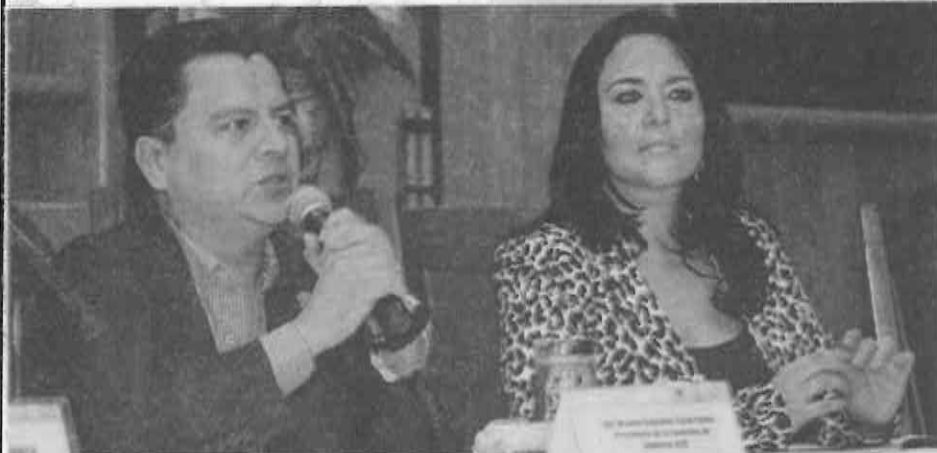
Recobrarán confianza de los trabajadores en las instituciones con este catálogo.

Refirió que "con este catálogo nos sumamos a este esfuerzo, vamos a ser pioneros también en la observancia y en la ejecución, y a pedirle a la Comisión de Derechos Humanos que trabajemos juntos en ello".