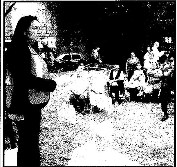
Rescatan Plaza Titipiles

"Si nos organizamos, los vecinos podemos luchar contra lo que atenta contra nuestra comunidad", aseguró la secretaria de la Comisión de Gobierno, al tiempo que manifestó su agradecimiento al Jefe de Gobierno por permitir que esta obra se realice. "Para muchos puede ser un espacio pequeño, pero surge de una larga lucha de más de dos años", expresó.