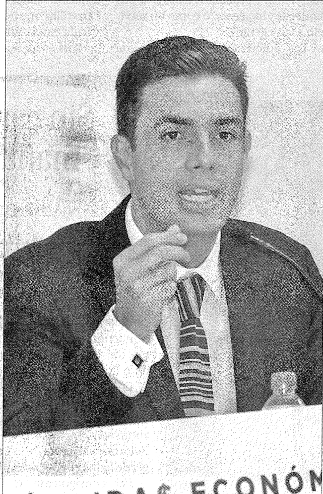
» EL ASAMBLEÍSTA Jesús Sesma.

Finalmente, comentó que del resto de las demarcaciones territoriales no se cuenta con información del tema.