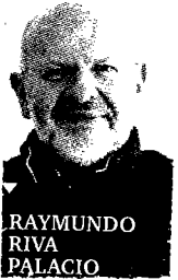
RAYMUNDO RIVA PALACIO

E l gobernador de Puebla, Rafael Moreno Valle, está en barrena. Lleva una semana en reuniones en la ciudad de México con políticos y medios para explicar que en los enfrentamientos del 9 de julio en San Bernardino, Chalchihuapan, que provocaron la muerte de un menor de 13 años, no hay responsabilidad de sus policías que actuaron, asegura, de acuerdo con los protocolos establecidos. El gobernador está descontrolado y con la mira extraviada al tratar de salvar con explicaciones legales, un problema político.