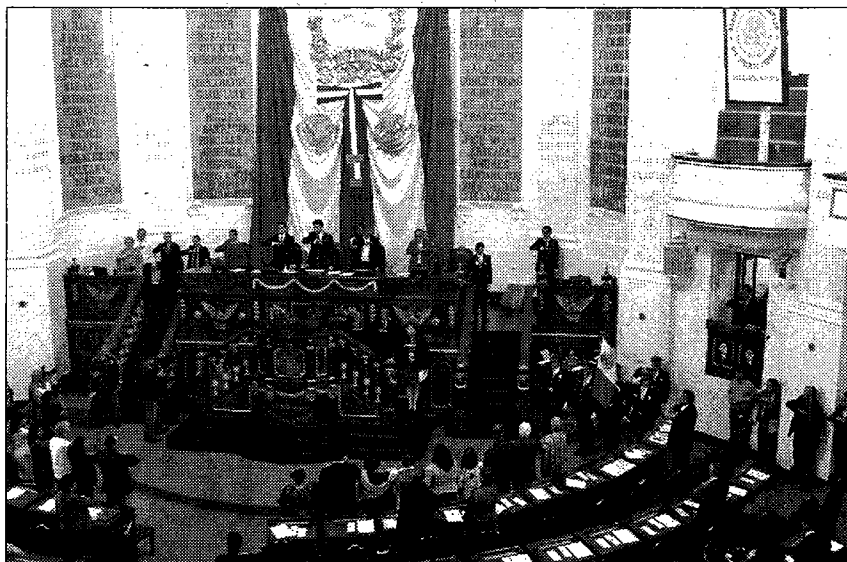
El miércoles, los diputados capitalinos integrantes de la comisión que investiga las irregularidades en la Línea 12 del metro se reunirán con el titular de la SFP.