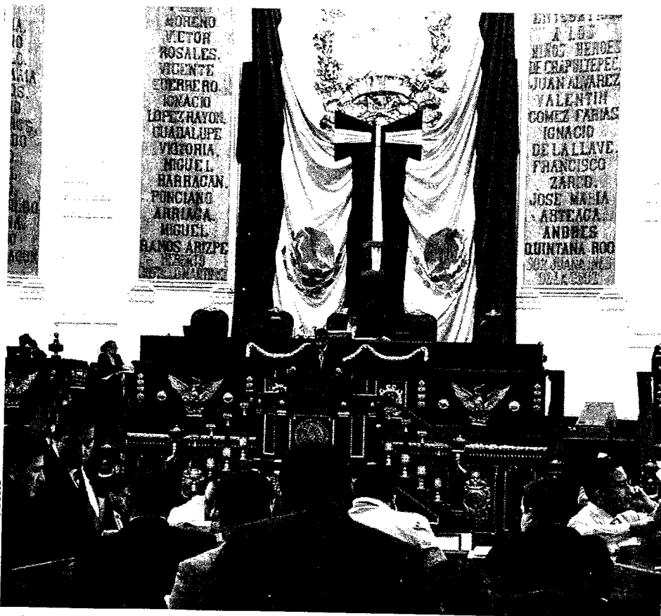
DISCUSIÓN. La propuesta se sometió al escrutinio ciudadano y después pasó al Pleno para su análisis.

Cuauhtémoc Velasco , coordinador de Movimiento Ciudadano en ALDF.