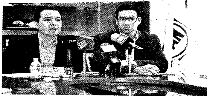
Quieren evitar otro News Divine o Lobohombo.

sentativo de la ciudad, ha crecido dos veces más rápido que el resto del sector de servicios de acuerdo al INEGI". Dijeron que 3 mil 800 establecimientos mercantiles de diversión nocturna en la capital cumplen con la ley; pero un número similar opera en la clandestinidad o sin cumplir cabalmente todos los requisitos legales, de ahí la importancia del programa "A este antro si le entro".