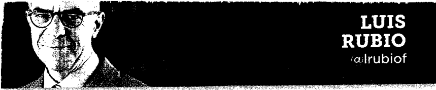
LUIS RUBIO @lrubiof

La economía industrial dual que nos caracteriza no hace sino retrasar el crecimiento de la economía y eleva el costo de la transición y del empleo.