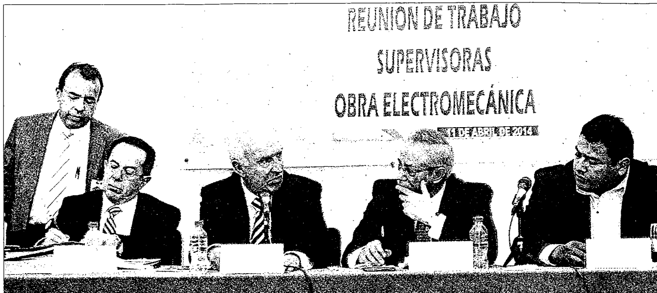
COMPARECENCIA. El representante de CONISA dejó entrever la falta de coordinación entre el consorcio y las autoridades locales.