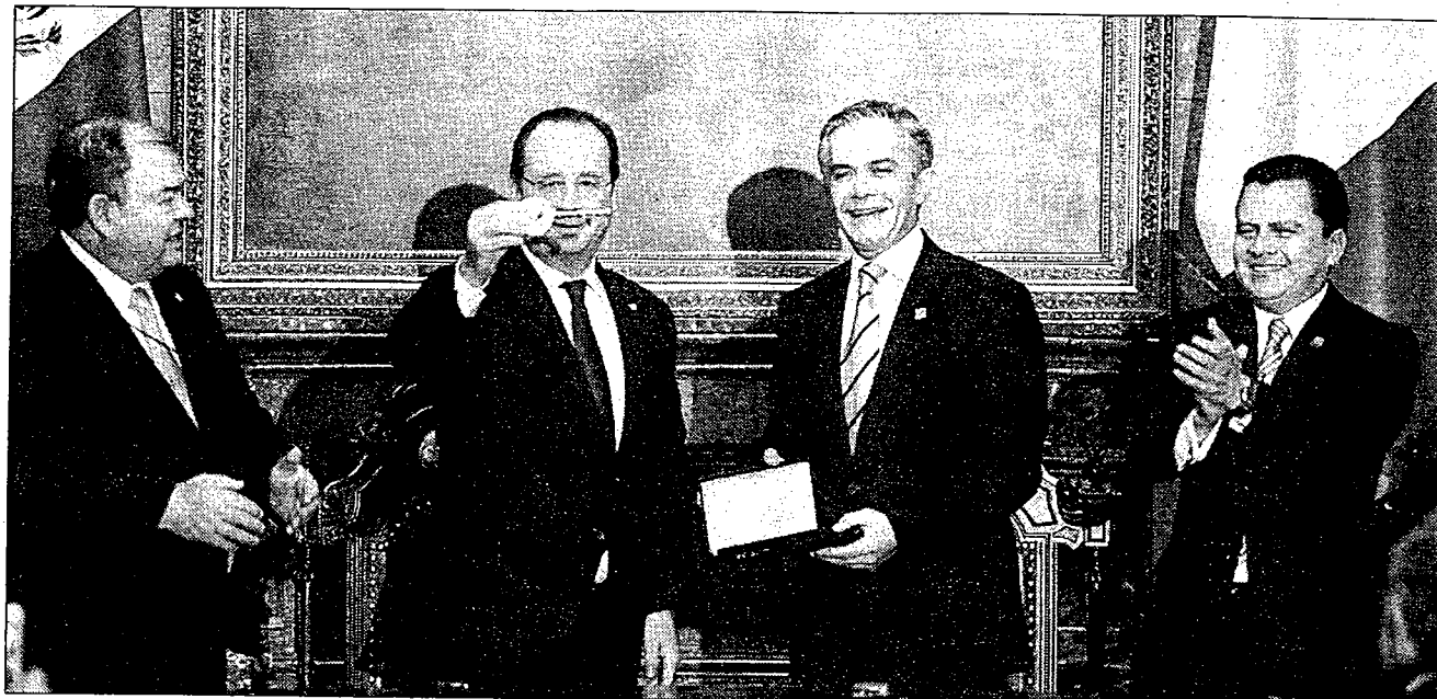
El presidente de Francia, François Hollande, muestra la llave de la ciudad, que le entregó el jefe de Gobierno del Distrito Federal, Miguel Ángel Mancera, al declararlo Huésped distinguido, ayer en el Antiguo Palacio del Ayuntamiento