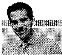
CARLOS LORET DE MOLA carlosloret@yahoo.com.mx