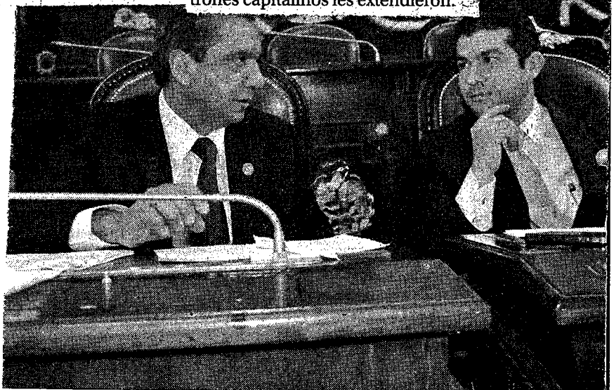
» ESTABLECERÁ CONTACTO la iniciativa privada con los asambleístas, senadores y diputados federales.

Finalmente, reconoció a los partidos políticos y a los candidatos que participaron en la contienda, pues siempre estuvieron dispuestos a dialogar y a compartir con los socios de la Coparmex Ciudad de México sus propuestas y visión de la ciudad, así como a escuchar sus preocupaciones y demandas, con un compromiso, incluso a través de su firma, a implementar las propuestas que los patronos capitalinos les extendieron.