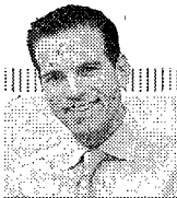
CARLOS LORET DE MOLA carlosloret@yahoo.com.mx