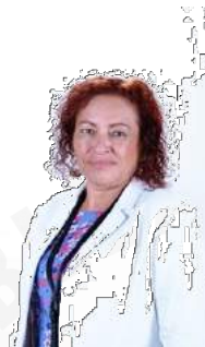
DIP. ABRIL YANNETTE TRUJILLO VÁZQUEZ PRESIDENTE