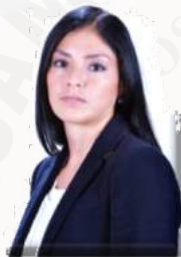
DIP. LOURDES VALDEZ CUEVAS PRESIDENTA