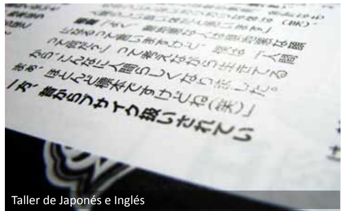
Taller de Japonés e Inglés