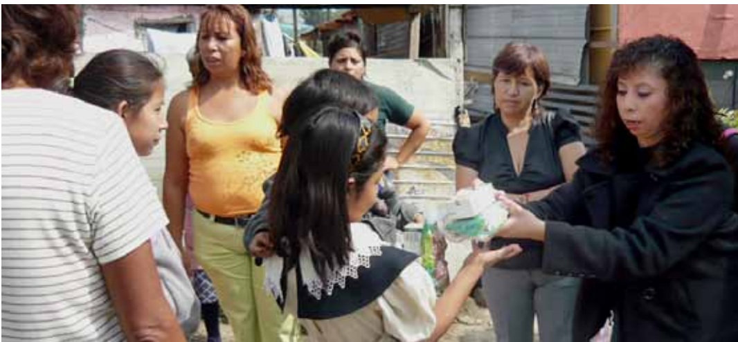
Conviniendo con vecinas del Distrito XXVIII.