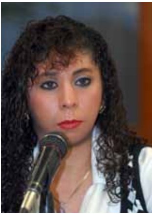
En conferencia de prensa luchando por el respeto, la equidad y la justicia social.