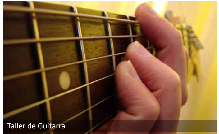
Taller de Guitarra