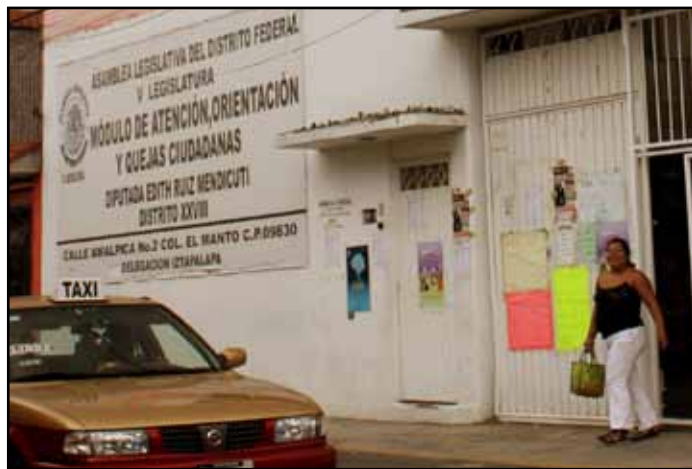
Módulo de Atención, Orientación y Quejas Ciudadanas del Distrito XXVIII.

En el período comprendido entre Diciembre de 2009 y Agosto de 2010 recibimos 3342 demandas ciudadanas, de las cuales 979 se refieren a la falta de seguridad, de patrullaje y de policías en la zona, 2321 son demandas de servicio, de las cuales 698 ya fueron satisfechas de manera positiva. 918 se tramitaron ante la Delegación y no han sido resueltas por la misma. A 42 vecinos les proporcionamos Asesoría Jurídica habiendo contribuido al éxito de sus casos.