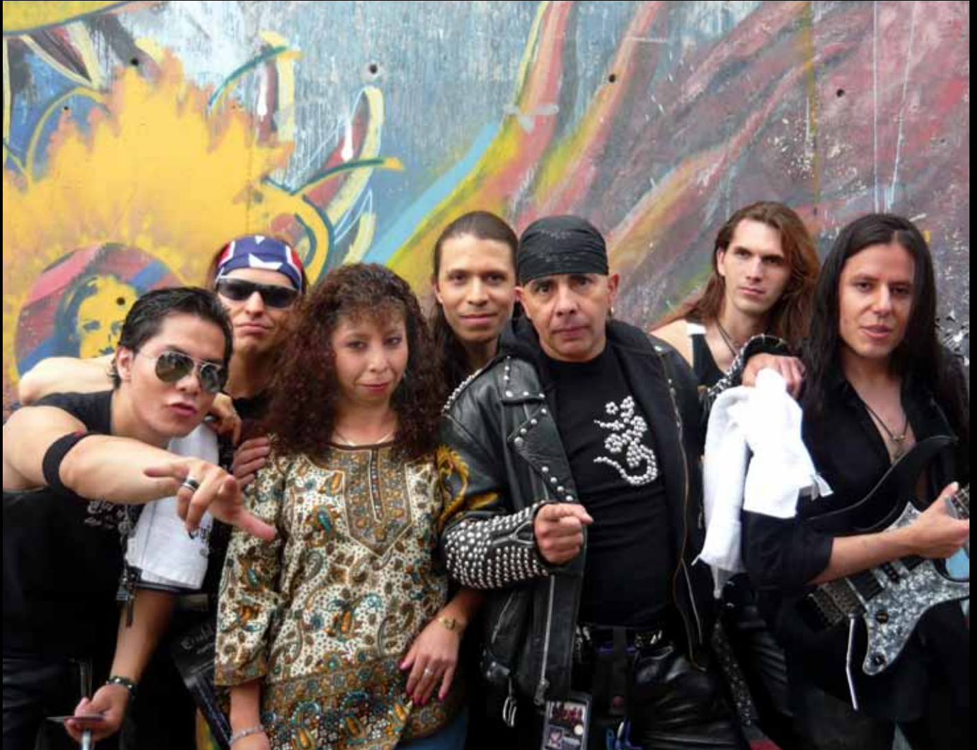
En el Faro de Oriente, con el Grupo Cristal y Acero.

“La cultura es toda la información y habilidades que posee el ser humano”.