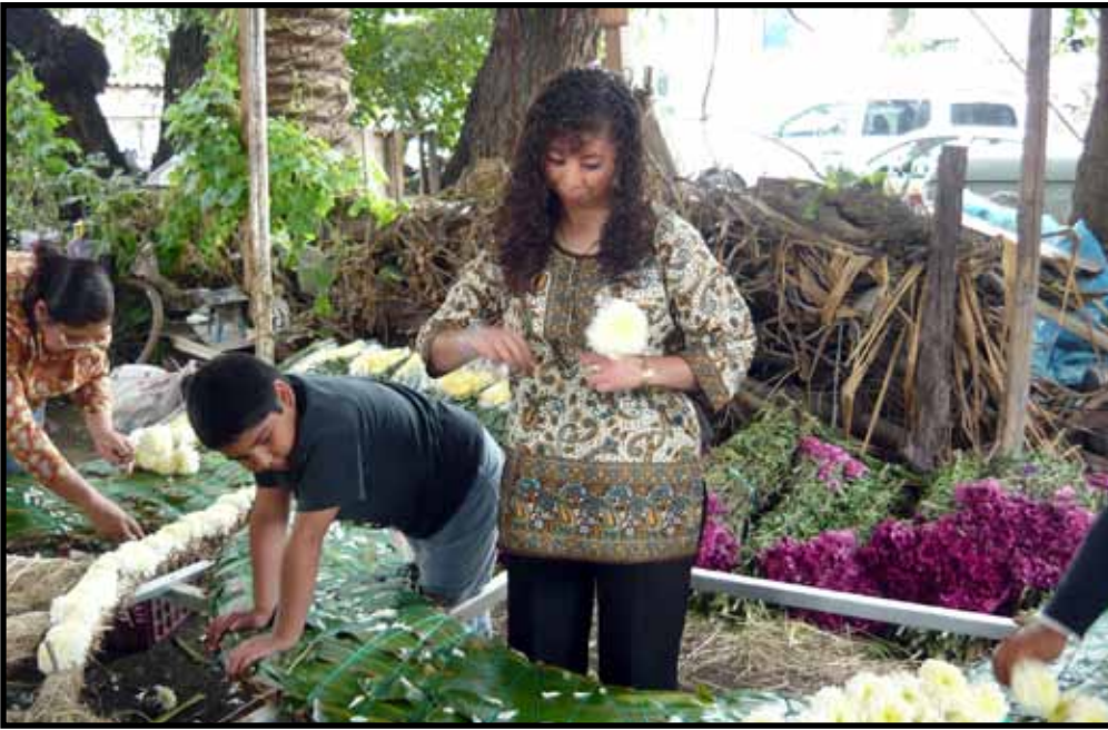
Trabajando con los artesanos del Barrio de la Asunción para las festividades tradicionales de Iztapalapa.