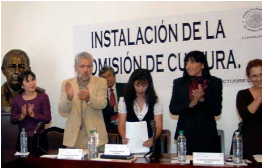
Instalación de la Comisión de Cultura de la ALDF, V Legislatura. Octubre 12 del 2009.