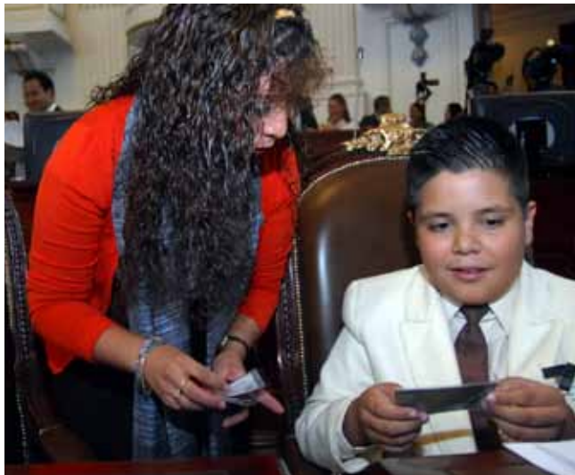
En el Recinto Legislativo durante el Parlamento Infantil.

El trabajo que presento, es resultado de un balance adecuado entre las tres actividades principales que, como Diputada Local por el XXVIII Distrito, en Iztapalapa, me ha tocado desarrollar. En él se encuentran plasmados, la consecución de los objetivos que han marcado mi carrera: la lucha por la equidad y la justicia social, por la cultura y la recreación; así como la inclusión de todos y cada uno de los ciudadanos dentro del ámbito de la Participación Ciudadana, dentro de la corresponsabilidad con nuestros gobiernos y nuestra sociedad civil.