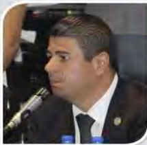
Dip. Israel Betanzos Cortés

“Creemos que esta Asamblea Legislativa del Distrito Federal, su VII Legislatura es un órgano colegiado electo democráticamente por los habitantes de la Ciudad de México, y que creemos tiene el peso político suficiente para dotar a esta ciudad de una Constitución.”