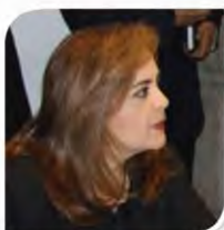
Sen. Ana Lilia Herrera Anzaldo

Presidente de la Comisión de Puntos Constitucionales de la Cámara de Diputados del H. Congreso de la Unión