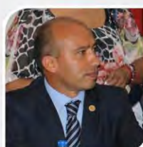
Dip. Héctor Barrera Marmolejo

Integrante de la Comisión del Distrito Federal del Senado de la República