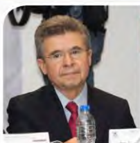
Sen. Enrique Burgos García

Presidenta de la Comisión del Distrito Federal de la Cámara de Diputados del H. Congreso de la Unión