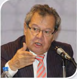
Dr. Porfirio Muñoz Ledo

Presidente del Consejo Consultivo de la Reforma Política del Distrito Federal