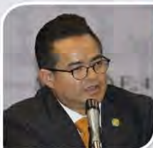
Dip. Leonel Luna Estrada

“Porque tenemos la certeza que el Congreso de la Unión cumplirá con su responsabilidad, nos proponemos ser una instancia, que con la representación que ostentamos, sea constructora de consensos, promotora de acuerdos, que exhorte y colabore con el Congreso de la Unión y las Legislaturas de los Estados para concretar la reforma a la Constitución Federal, en materia de reforma política del Distrito Federal.”