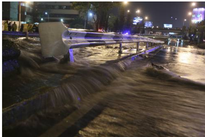
La fuerte lluvia que azotó ayer la ciudad rebasó la capacidad de desfogue del drenaje, lo que ocasionó que el agua saliera por los respiraderos e inundara el Viaducto Miguel Alemán. 17 de abril de 2011

La fuerte lluvia provocó filtraciones y desbordamientos en el drenaje que corre por la citada vialidad y aunque se habló de una fractura del entubado, el Gobierno del DF afirmó que en realidad se trató de una saturación por la fuerte precipitación que cayó, lo que provocó que una gran cantidad de agua saliera por los respiraderos del drenaje, situación que fue controlada pasadas las 10 de la noche, según informó el Sistema de Aguas de la Ciudad de México (SACM)...”.